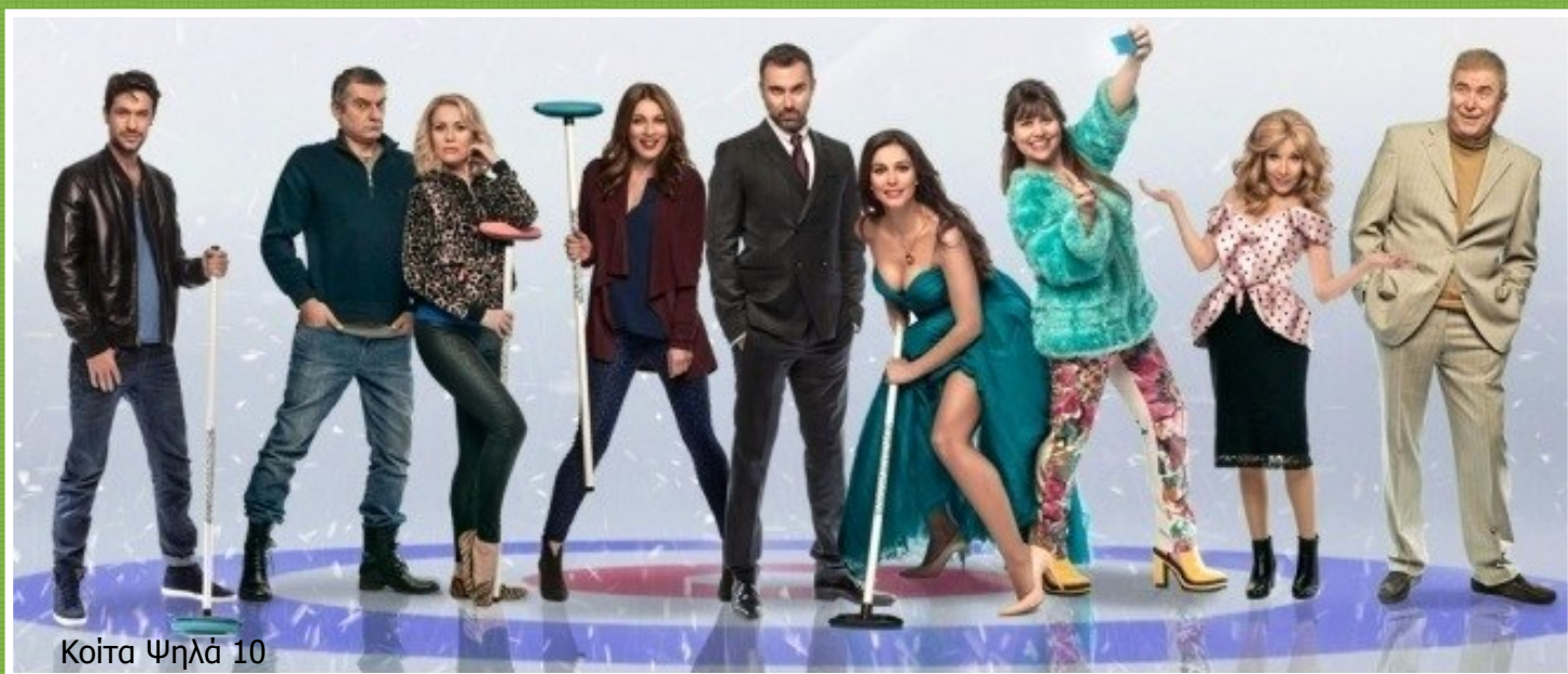
Κοίτα Ψηλά 10

Μακάρι όλοι μας να μην βλέπουμε ως εμπόδια τις δυσκολίες της ζωής αλλά ως σκαλοπάτια που μας βοηθούν να ανέβουμε πιο πάνω και να κερδίσουμε το στόχο μας.