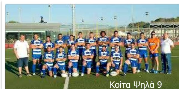
Κοίτα Ψηλά 9

Έτσι είναι και η κατάσταση με τα αθλήματα. Όλοι τα ξέρουμε, ποιοι από εμάς όμως θα ακολουθήσουν αυτό που πραγματικά θέλουν; Έτσι λοιπόν όταν έρθουν τα παιδιά σας και σας ζητήσουν να κάνουν ένα άθλημα σαν και αυτά ενθαρρύνετέ τα και αφήστε τα να δοκιμάσουν αυτό το άθλημα που νιώθουν να τα γεμίζει και να τους δίνει χαρά.