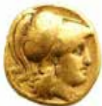
Κοίτα Ψηλά 4

Έχει φτάσει στα αυτιά πολλών τις τελευταίες ημέρες μια είδηση που κάνει τον γύρο του κόσμου: η ανακάλυψη του τάφου της Αμφίπολης. Μέχρι τώρα καθώς διασχίζαμε τον δρόμο παρατηρούσαμε το μεγαλοπρεπές λιοντάρι, ωστόσο σήμερα κάτι νέο, λαμπρότερο έρχεται να προστεθεί στα "αρχαία της Αμφίπολης".