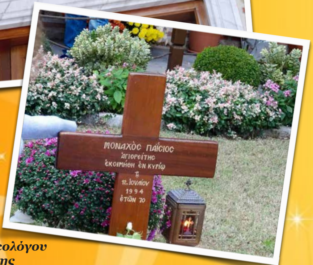
Ιερόν Ησυχαστήριον Αγίου Ιωάννου του Θεολόγου Σουρωτή Θεσσαλονίκης