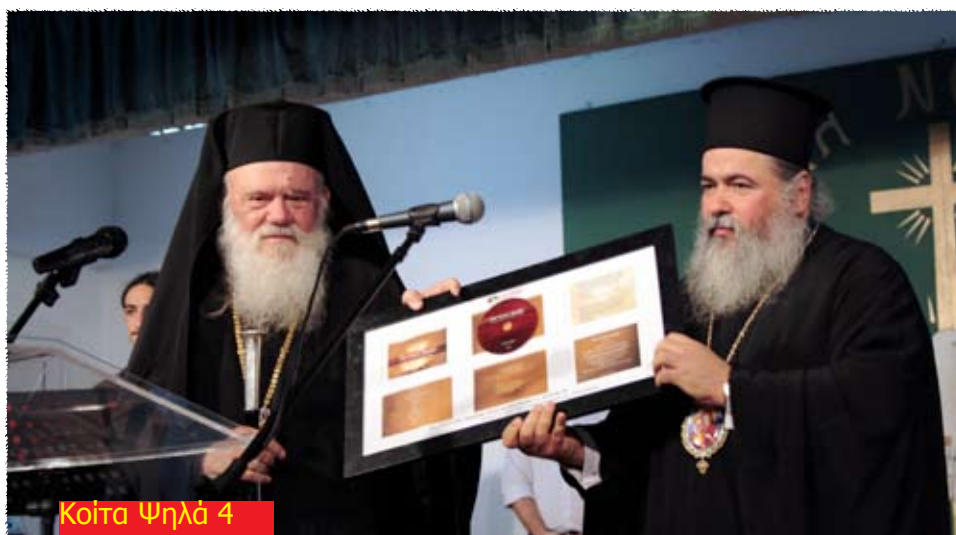
Κοίτα Ψηλά 4