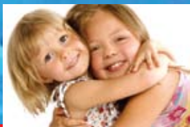
ΓΙΑ ΤΑ ΑΤΟΜΑ ΜΕ ΕΙΔΙΚΕΣ ΑΝΑΓΚΕΣ