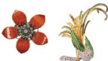
Κοίτα Ψηλά 8