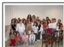
Ενοριακές φιλικές συντροφιές