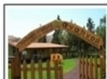
Παιδικός σταθμός "Αναπνοή"