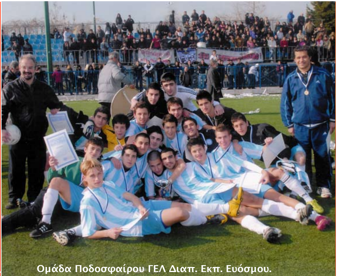
Ομάδα Ποδοσφαιρού ΓΕΛ Διαπολ. Εκπ. Ευόσμου.

Η μεγαλύτερη μέχρι σήμερα διάκριση για ομάδα ποδοσφαιρού Λυκείων Δυτ. Θεσσαλονίκης