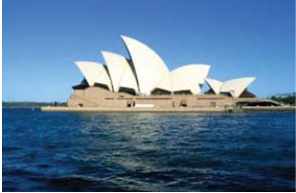
Η όπερα του Σίδνεϊ