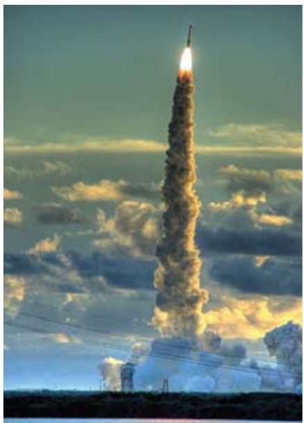
Το ακρωτήριο Κένεντι