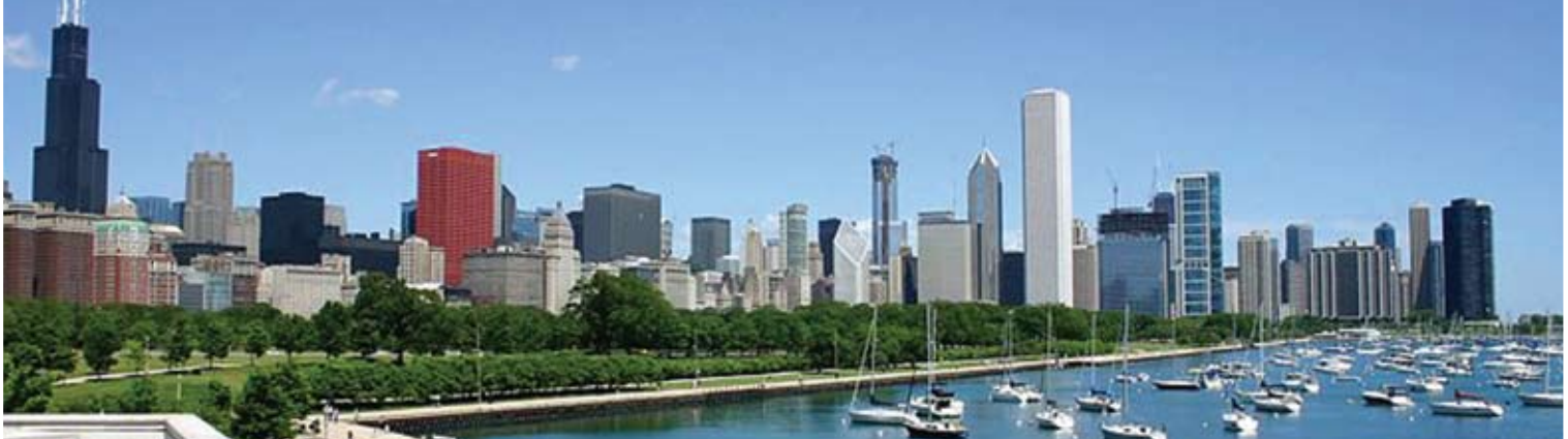
Ο ουρανοξύστης Shears του Σικάγου