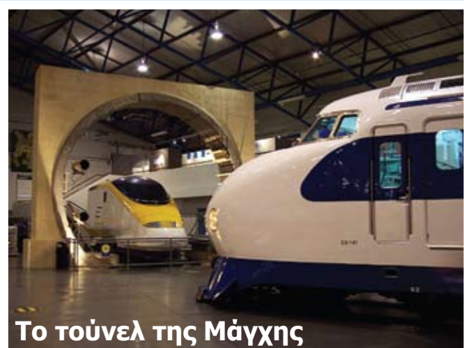
Το τούνελ της Μάγχης